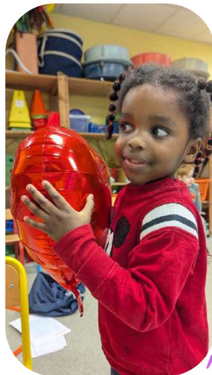
SÉANCE N°5 : THÉÂTRE ET EMPATHIE