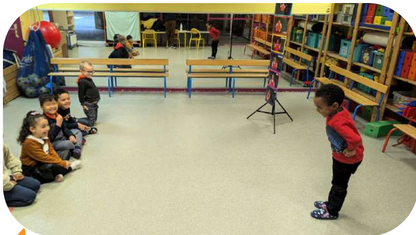
SÉANCE N°2 : LES ÉMOTIONS