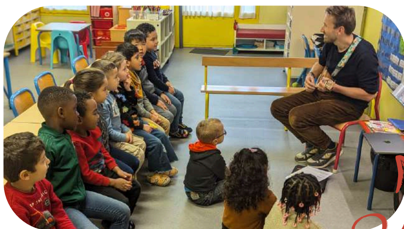
SÉANCE N°3 : PRÉSENTATION DU SPECTACLE