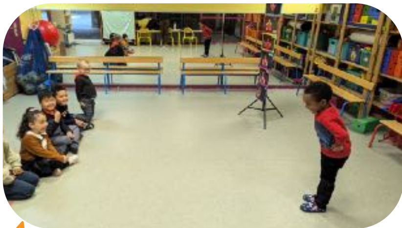
SÉANCE N°2 : LES ÉMOTIONS