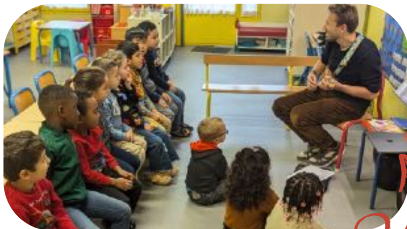
SÉANCE N°3 : PRÉSENTATION DU SPECTACLE