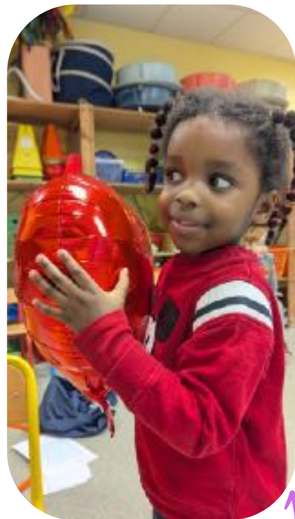
SÉANCE N°5 : THÉÂTRE ET EMPATHIE